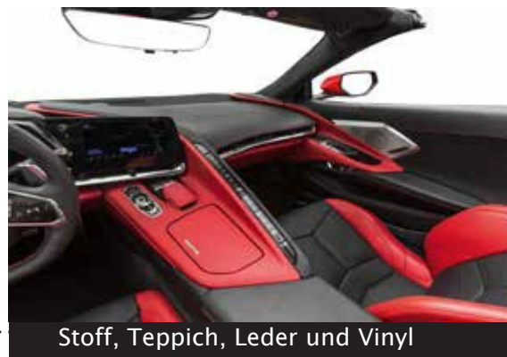
Stoff, Teppich, Leder und Vinyl

XPEL FUSION PLUS UPHOLSTERY Keramikbeschichtung schützen Ihre Stoff-, Teppich-, Leder- und Vinyloberflächen durch schmutz- und spritzabweisenden sowie hydrophoben Eigenschaften. Das Produkt ist für jahrelangen Schutz ausgelegt.